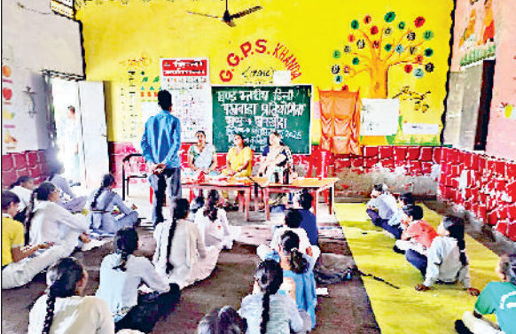
खरखौदा। हिंदी पखवाड़ा प्रतियोगिता में भाग लेते विद्यार्थी।