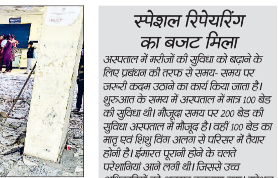
सोनीपत। रिपेयरिंग के लिए उखाड़ी गई सड़क, ओपीडी में फर्श व शौचालय में कार्य करते हुए ठेकेदार के कर्मचारी।

रास्ते बंद किए गए हैं। अस्पताल प्रशासन ने मरीजों की सुविधा के लिए वैकल्पिक व्यवस्था करने का प्रयास किया है, लेकिन भीड़ अधिक होने के कारण परेशानियां कम नहीं हो पा रही है।