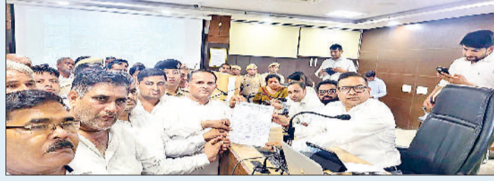
सोनीपत। अपनी मांगों को ज्ञापन जिला उपायुक्त को सौंपते किसान।

विभागीय अड़चनों की वजह से अब तक कोई समाधान नहीं निकल पाया है। इससे यह संभावना बढ़ गई है कि इस बार चीनी मिल का पेराई सत्र निर्धारित समय पर शुरू नहीं हो पाएगा। जिसके चलते समय पर पेराई न होने का सीधा असर जिले के गन्ना किसानों पर पड़ेगा। अगर कारखाने का काम समय पर शुरू नहीं हुआ, तो किसानों की फसल खेतों में खड़ी-खड़ी खराब हो सकती है, जिससे उन्हें भारी आर्थिक नुकसान उठाना पड़ सकता है।