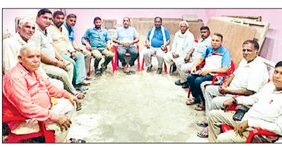
गन्नौर। विश्वकर्मा पूजन कार्यक्रम की तैयारियों को लेकर बैठक करते हुए।