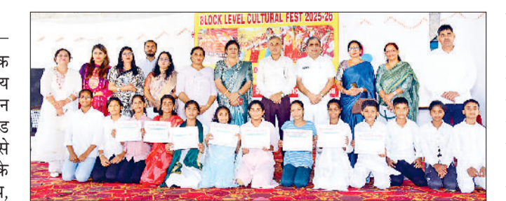
गोहाना। समारोह में उत्कृष्ट प्रदर्शन करने वाले मेधावी विद्यार्थी अतिथियों व शिक्षकों के साथ।