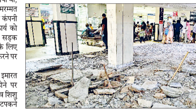
सोनीपत। रिपेयरिंग के लिए उखाड़ी गई सड़क, ओपीडी में फर्श व शौचालय में कार्य करते हुए ठेकेदार के कर्मचारी।

की तोड़फोड़ का काम भी शुरू कर दिया गया है। ढेका लेने वाली कंपनी ने पूरी टीम के साथ कार्य की गति तेज कर दी है ताकि यह काम जल्द से जल्द पूरा हो सके। हालांकि मरम्मत कार्य के चलते मरीजों और उनके परिजनों को काफी परेशानी का सामना करना पड़ रहा है। ओपीडी में आने वाले मरीजों को धूल और शोरगुल के बीच इलाज करना पड़ रहा है। अस्पताल के कुछ हिस्सों में अस्थायी रूप से