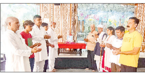
गोहाना। स्वामी शिवानंद सरस्वती के चित्र पर पुष्प अर्पित करते हुए नागरिक।